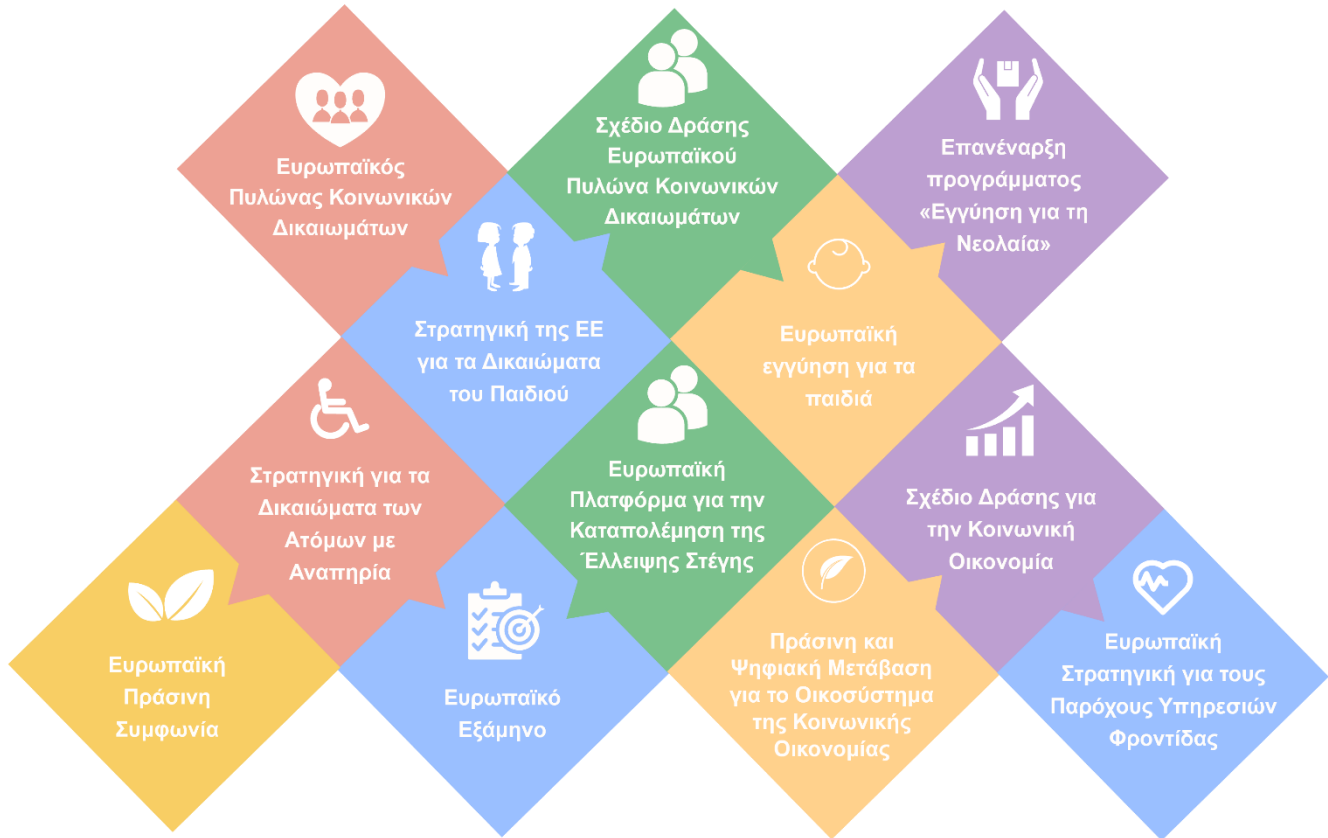
Σχήμα 8 - Σχετικά πλαίσια πολιτικής για κοινωνικές υπηρεσίες σε επίπεδο ΕΕ.

Αυτά τα πλαίσια πολιτικής 8 είτε περιέχουν και/ή προωθούν γενικές αρχές που διατυπώνονται στον Ευρωπαϊκό Πυλώνα Κοινωνικών Δικαιωμάτων – όπως «εκπαίδευση, κατάρτιση και δια βίου μάθηση» (1.), «ενεργή υποστήριξη στην απασχόληση» (4.), «παιδική φροντίδα και υποστήριξη σε παιδιά» (11.),