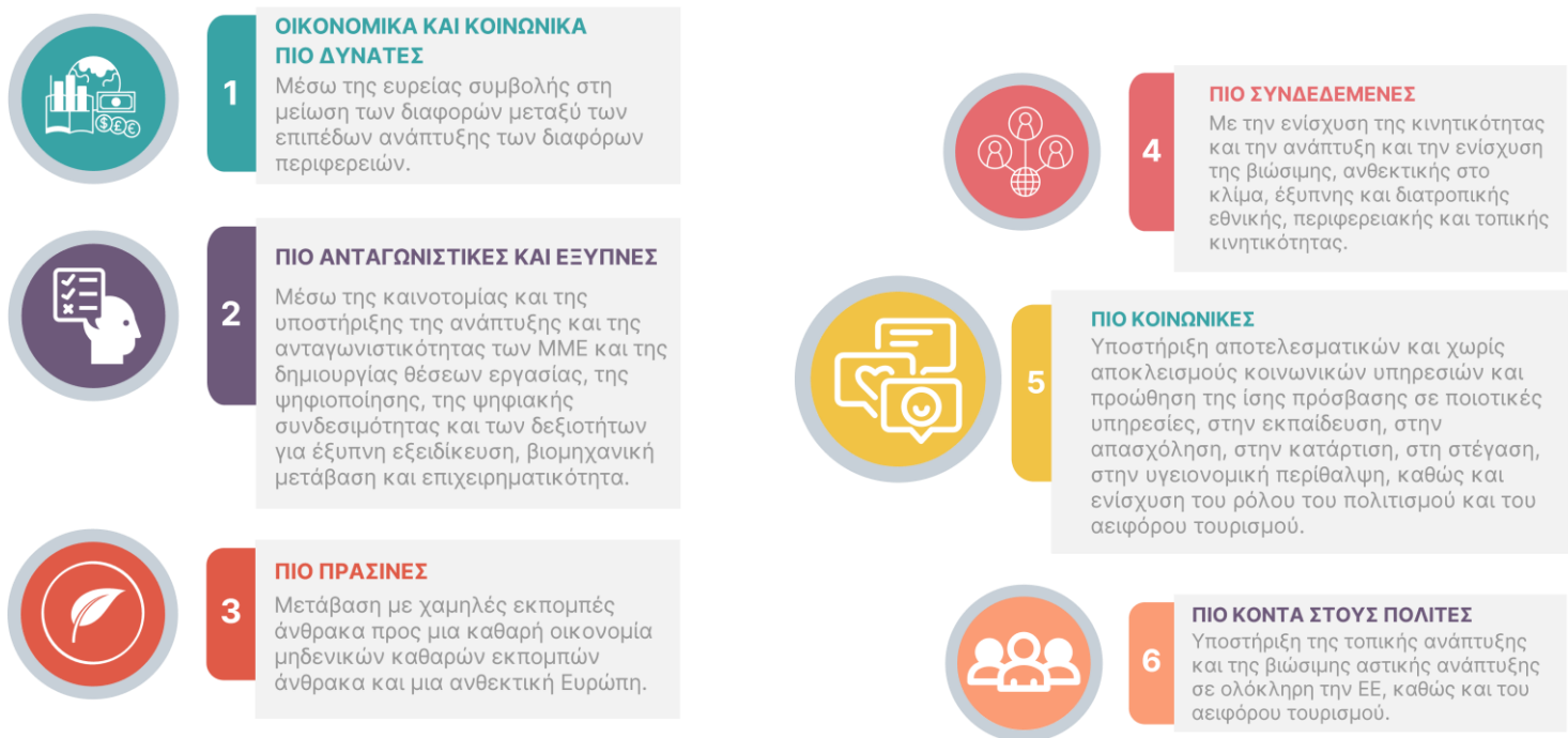
Σχήμα 3 - Στόχοι ΕΤΠΑ

Το 2021-2027, το ταμείο θα επιτρέψει τις επενδύσεις να καταστήσουν την Ευρώπη και τις περιφέρειές της 2 :