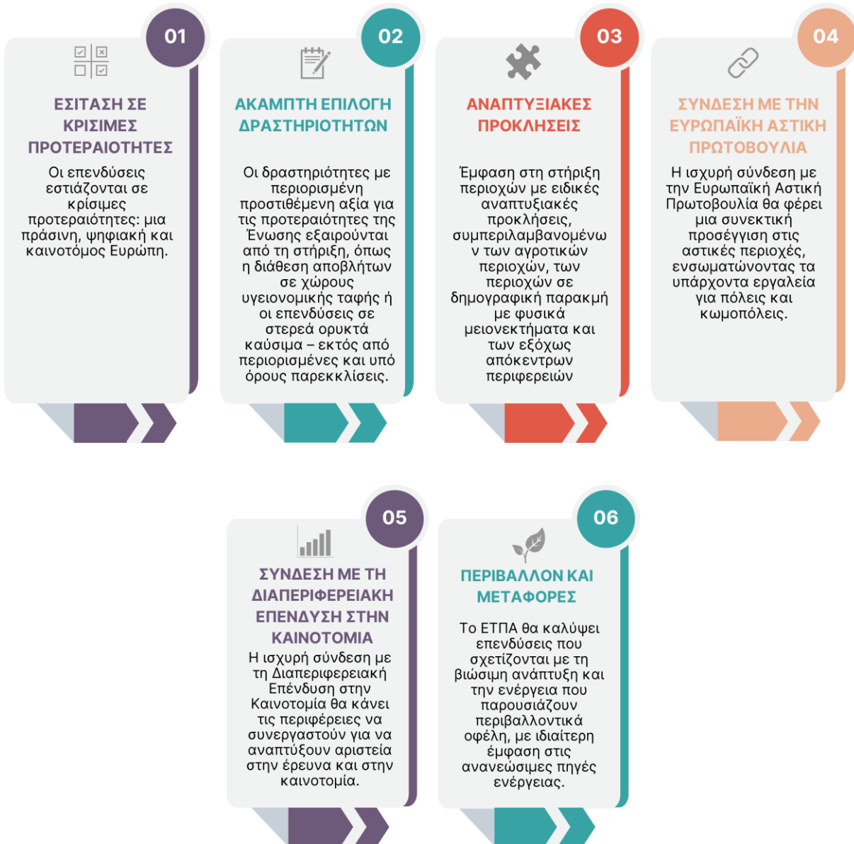
Σχήμα 4 - Τι νέο υπάρχει στο ΠΔΠ του ΕΤΠΑ 2021-2027;