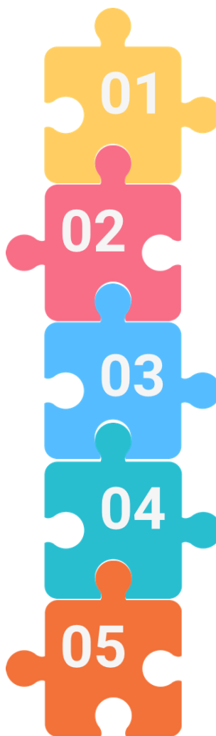
Σχήμα 9 – Επισκόπηση πλαισίων πολιτικής.

Στοχεύει στη βελτίωση της διαθεσιμότητας, της προσβασιμότητας, της οικονομικής προσιτότητας και της ποιότητας των υπηρεσιών φροντίδας, στη μετάβαση από την ιδρυματική φροντίδα στην κατ' οίκον περίθαλψη και σε υπηρεσίες με βάση την κοινότητα, στη στροφή προς την προσωποκεντρική ολοκληρωμένη φροντίδα, σε καλύτερες ψηφιακές δεξιότητες καθώς και σε βελτιωμένες συνθήκες εργασίας και καλύτερη πρόσβαση σε ευκαιρίες αναβάθμισης δεξιοτήτων και επανεκπαίδευσης.