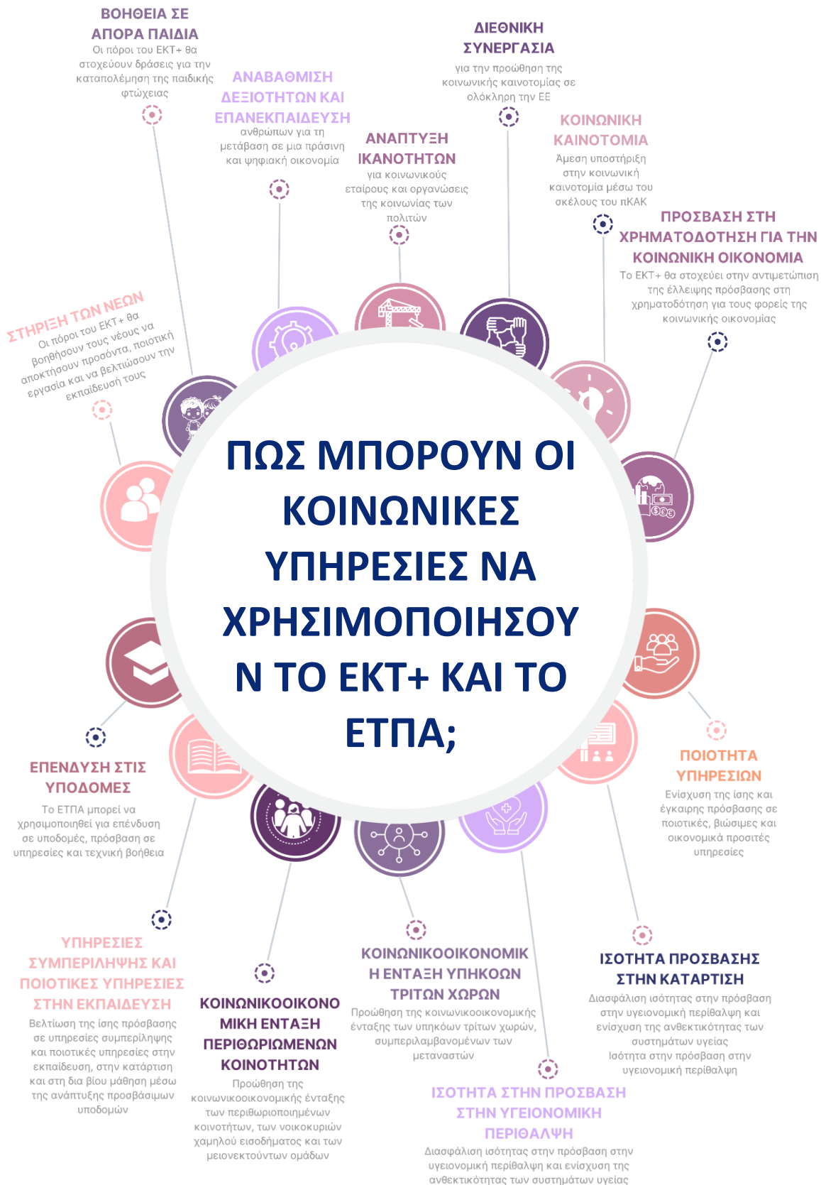
Σχήμα 5 - Πώς μπορούν οι κοινωνικές υπηρεσίες να χρησιμοποιήσουν το ΕΚΤ+ και το ΕΤΠΑ;