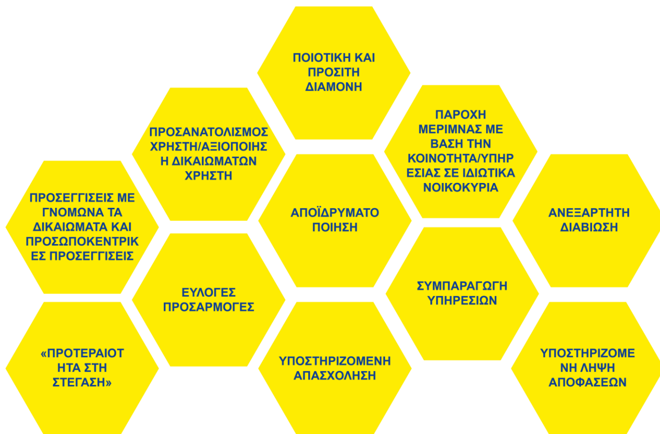
Σχήμα 7 – Σχετικές έννοιες, δικαιώματα, αρχές ή προσεγγίσεις για αποτελεσματικά μοντέλα οργάνωσης υπηρεσιών.

Ποια είναι τα σχετικά πλαίσια πολιτικής σε επίπεδο ΕΕ για τις κοινωνικές υπηρεσίες; Λαμβάνοντας υπόψη τους υποτομείς κοινωνικών υπηρεσιών στους οποίους εστιάζει το έργο Helpdesk Κοινωνικών Υπηρεσιών, αλλά και τον ευρύτερο τομέα των κοινωνικών υπηρεσιών (που καλύπτει, π.χ., επίσης ζητήματα όπως η οικονομικά προσιτή στέγαση, η κοινωνική στέγαση, η μετανάστευση, οι πρόσφυγες και οι αιτούντες άσυλο ή η ψυχική υγεία) και του οικοσυστήματος της κοινωνικής οικονομίας, ο παρακάτω κατάλογος αντικατοπτρίζει εκείνα τα πλαίσια πολιτικής σε επίπεδο ΕΕ που διαμορφώνουν τις σχετικές πολιτικές σε επίπεδο ΕΕ και τη χρήση του ΕΚΤ+ και του ΕΤΠΑ.